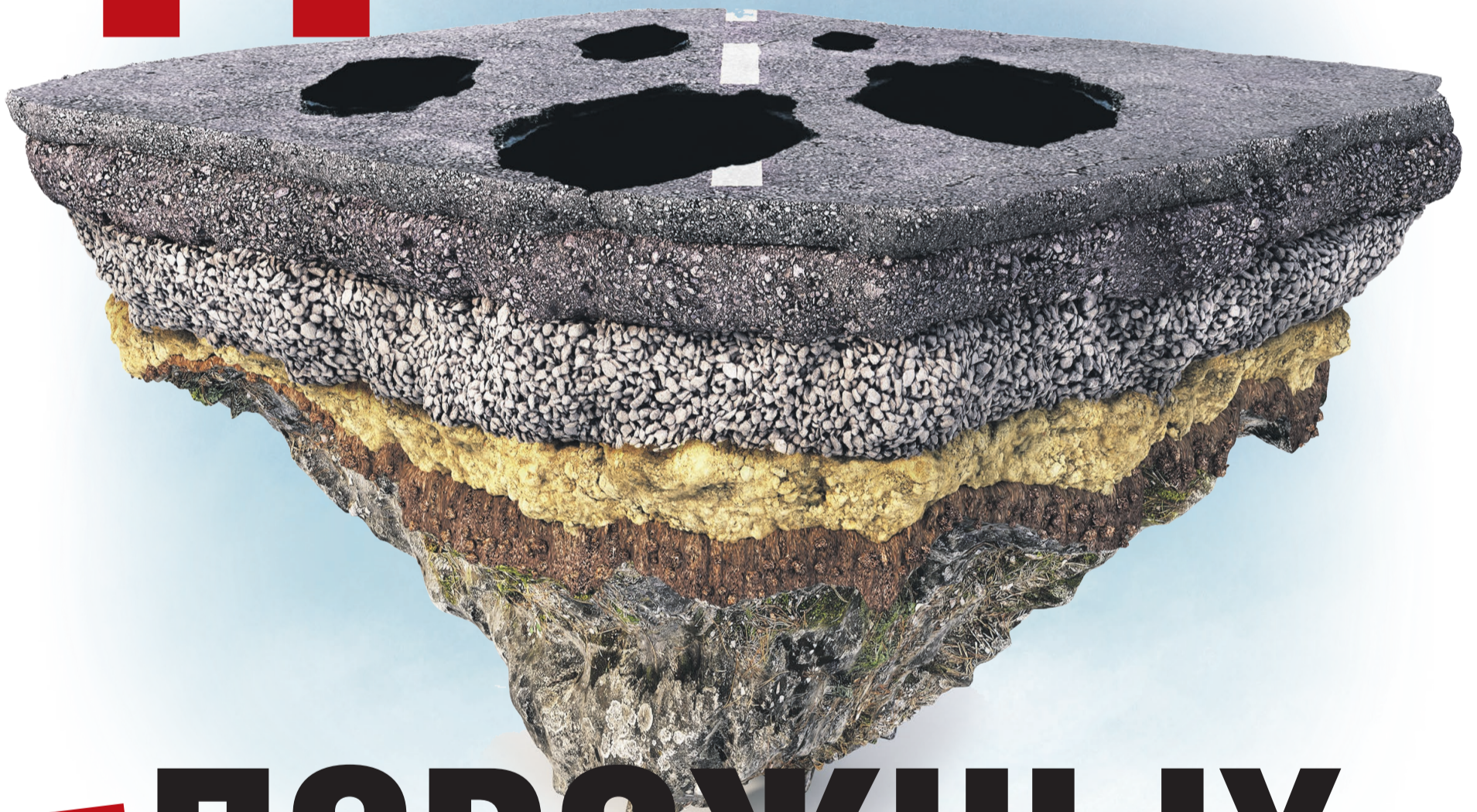
Фото: 123rf.com, коллаж: Алексей Беленёв